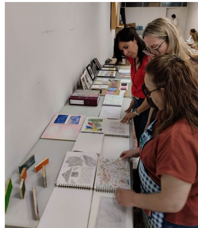
Exposición de trabajos del alumnado

Undefasa afirma que “es un placer colaborar en iniciativas como el Curso de Texturas Creativas en l'Alcora. Valoramos especialmente estos espacios que conectan formación y empresa, y que permiten acercar el talento al entorno profesional del sector cerámico. Gracias por la acogida y por impulsar este tipo de programas formativos tan necesarios”.