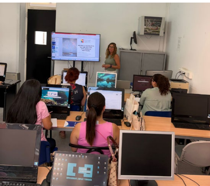
Curso IA en Burriana