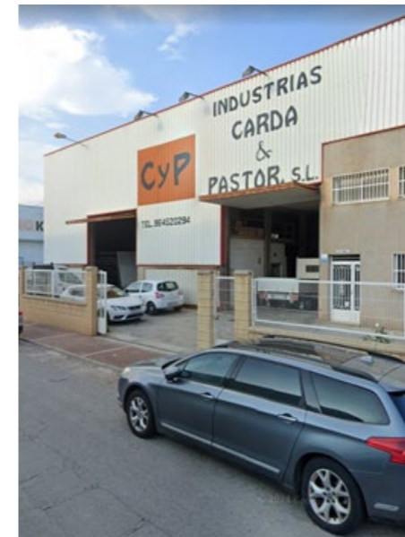
Industrias Carda y Pastor