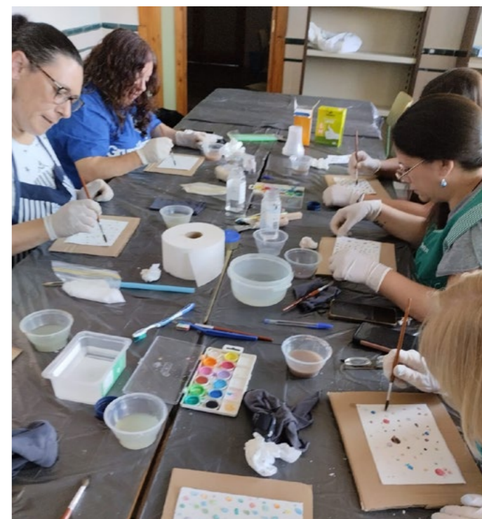
Curso en Betxí