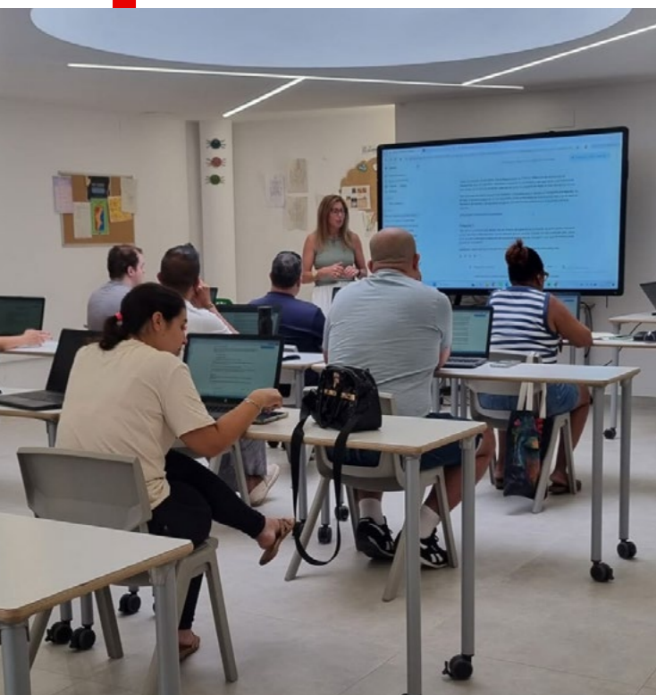
Curso IA en Almassora