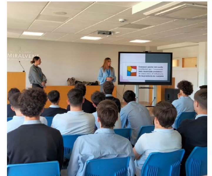
Colegio Miralvent de Betxí

El alumnado de bachiller del Colegio Miralvent y del Instituto de Betxí han recibido una jornada de orientación laboral y emprendimiento cada uno, con el objetivo de acercar el mundo profesional a los jóvenes y ayudarles a descubrir nuevas oportunidades de futuro.