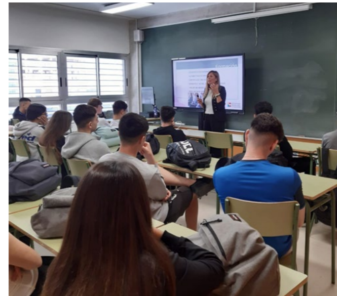
IES de Betxí