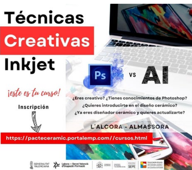
Cartel del curso