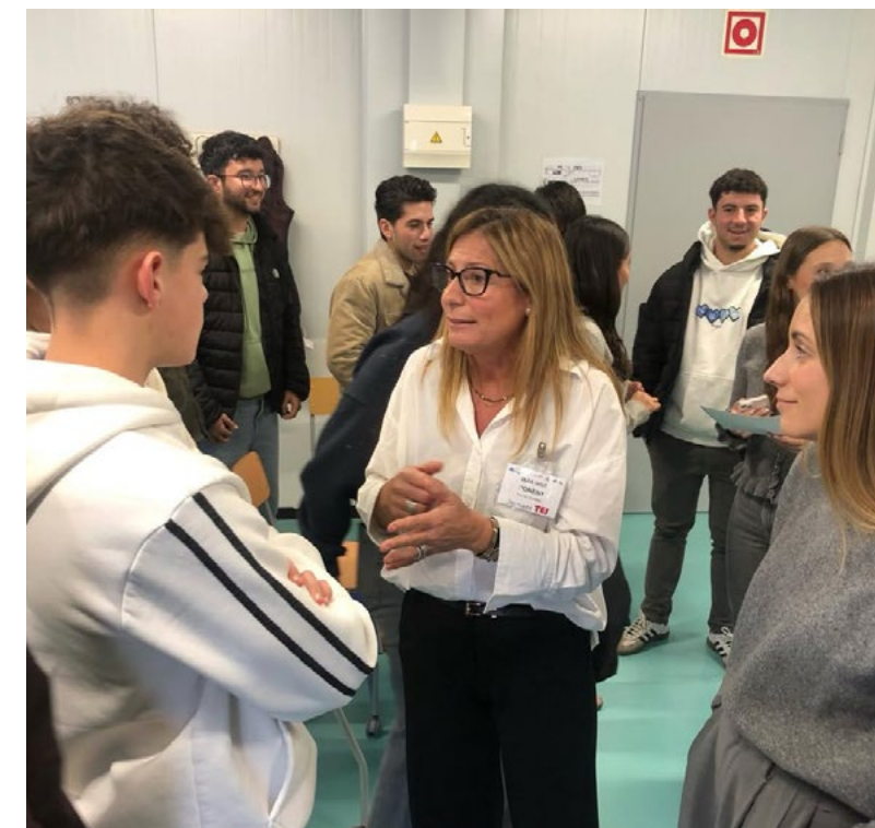
Resolviendo dudas del alumnado

Esta acción se suma a las líneas de trabajo impulsadas por el Pacto para reducir la distancia entre el ámbito educativo y el empresarial, reforzar la empleabilidad y favorecer la detección y el desarrollo del talento joven. Desde el Ayuntamiento de Burriana se continúa apostando por iniciativas que generen oportunidades, impulsen el espíritu emprendedor y contribuyan a un desarrollo económico.