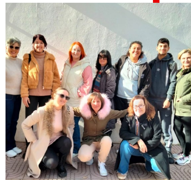
Alumnado de esta edición