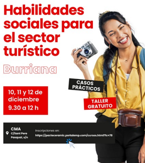
Cartel del curso