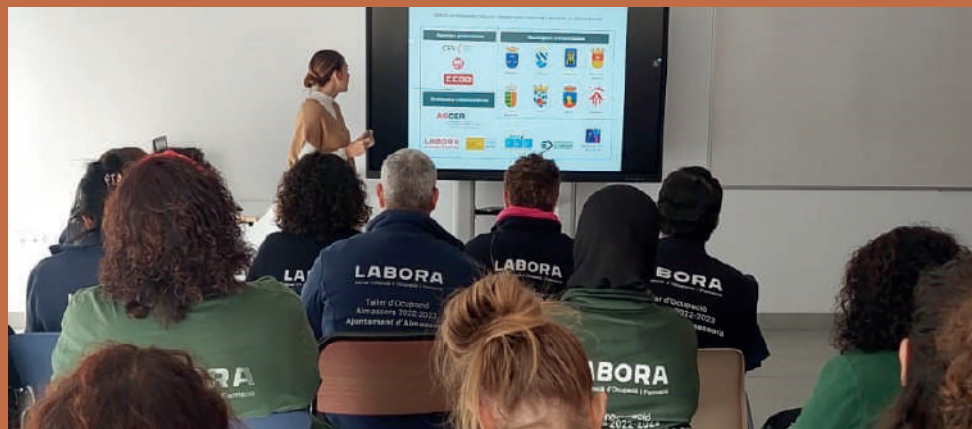
Dentro de los servicios realizados en este programa están las formaciones y talleres de Emprendimiento y Orientación laboral dirigidos a distintos perfiles de participantes

El Pacto Territorial por el Empleo de los Municipios Cerámicos y su Área de Influencia de la Provincia de Castellón trabaja para vertebrar el territorio, conectando a la administración, empresas y personas de nuestro territorio.