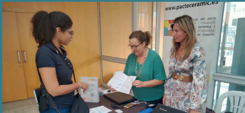
Desde la primera jornada, el equipo del Consorcio contó con un puesto informativo en el que explicó los servicios gratuitos que presta a los municipios consorciados y a su población.

Feria Destaca se ha posicionado un año más como referente en la Comunitat Valenciana de este tipo de evento, recalando en 2023 en l'Alcora, uno de los ejes del clúster cerámico provincial. Como finalidad, a través de las voces más innovadoras del sector, ha querido colaborar en la búsqueda de soluciones a la crisis y los desafíos que afronta la cerámica, motor económico de Castellón